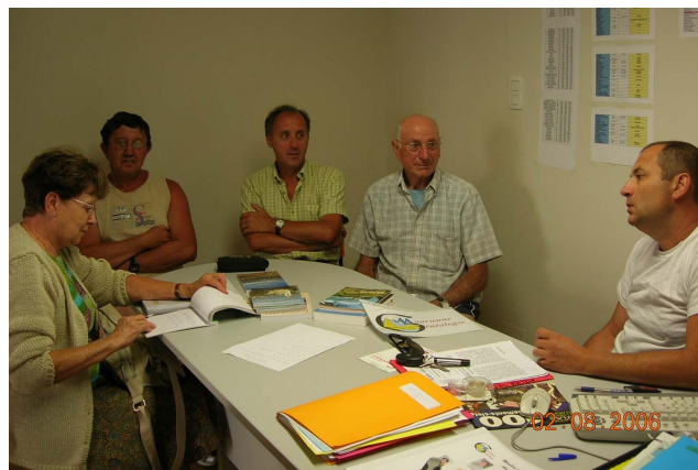
Une partie de l'équipe à votre disposition